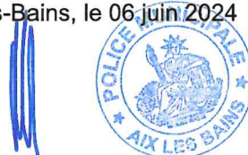
Le Maire d'Aix-les-Bains Renaud BERETTI